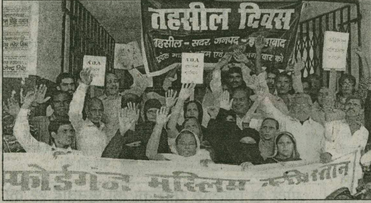
सदर तहसील में एसडीएम का घेराव करते लोग।

कब्रिस्तान की भूमि को एडीए के सुपर्द कर दिया है, जो गैर कानूनी है। जबकि वहां अल्पसंख्यक समुदाय के पूर्वज दफन हैं और दफनाया भी जाता है। जिस पर